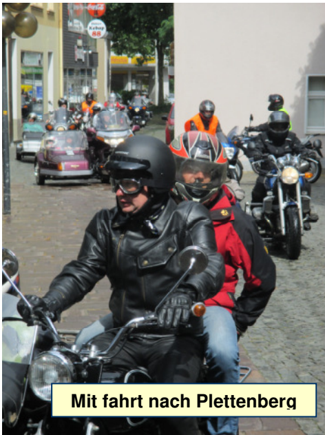
Mit fahrt nach Plettenberg