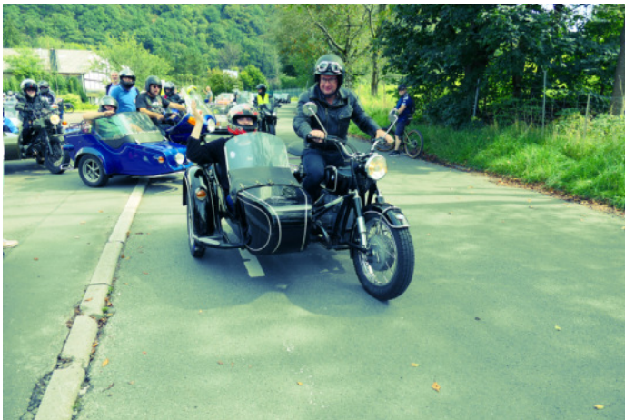
Mitfahrt nach Plettenberg