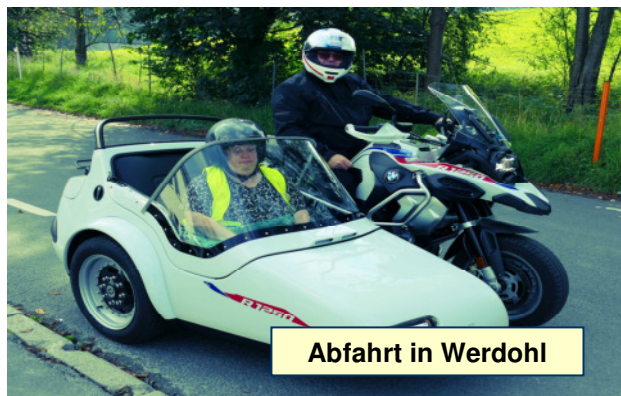
Abfahrt in Werdohl

Das Gespannfahren 2024 findet zusammen mit dem Werkstattfest statt auf dem Gelände vom Ev. Johanneswerk gGmbH | Studjo Gewerbestr. 10 58791 Werdohl Kettling Sie Erreichen die Werkstätten über die A45, (zwischen Lüdenscheid Nord und Mitte ist die A45 komplett gesperrt)